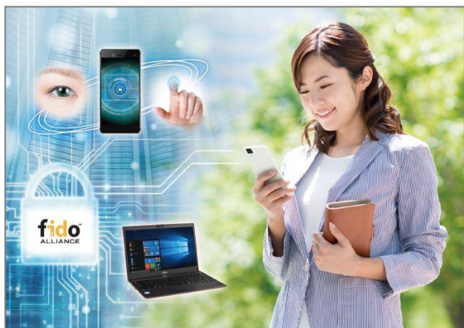
富士通のオンライン生体認証サービス

生体情報と新たな認証の仕組みによって、オンライン認証における安全性と利便性の両立を実現した次世代の国際認証規格FIDOの最新動向について、セキュリティの専門家が詳しく解説します。富士通のオンライン生体認証サービスは、お客様のFIDO導入をトータルで支援するサービスです。お客様のビジネスから社内利用まで柔軟に対応できる豊富な機能／サービスラインナップの詳細と、活用事例や関連サービスについてご紹介します。