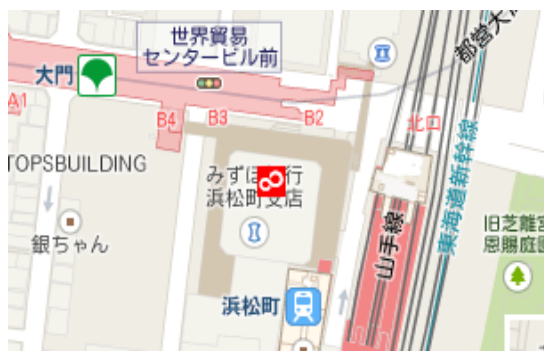
浜松町駅構内図(2階)

JR(山手線/京浜東北線) 浜松町駅 直結 東京モノレール 浜松町駅 直結 都営地下鉄(浅草線/大江戸線) 大門駅 直結(B3出口)