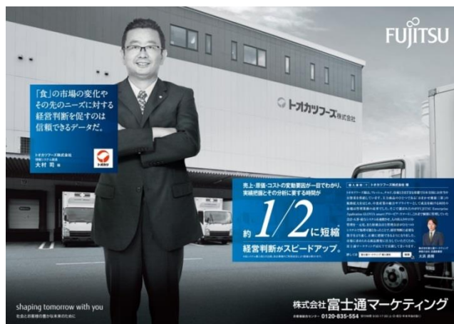
「トオカツフーズ様」の導入事例雑誌広告

既存商品の安定供給、新規商品の企画・開発など業界の多様なニーズに対応し、経営基盤の強化と経営判断の迅速化を図るため、会計・人事・給与の統合ソリューション「FUJITSU Enterprise Application GLOVIA smart」を導入。